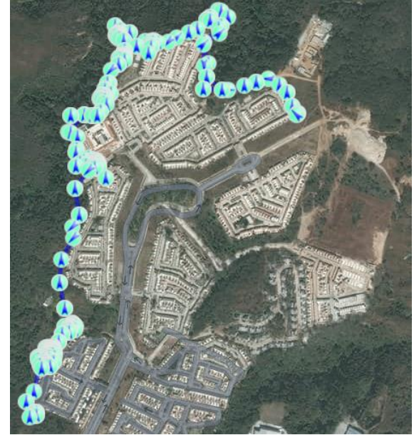
Recorrido rondín externo (San Basilio – San Fermín)